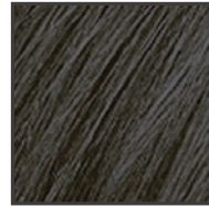
青みをおびた気品ある濃墨カラー

カラーリングクリームは、単色でも混ぜても使えます。残っても次回に使えるので経済的です。