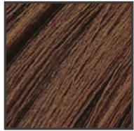
落ちつきのある自然な栗色