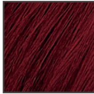
上品でシックな深いワインレッド