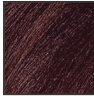
深みのある大人のこげ茶色